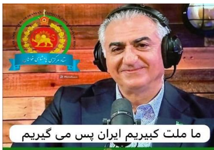
ما ملت کبیریم ایران پس می گیریم هن اینجا نیستیم که تاریخ بنویسیم هن اینجا هستیم که تاریخ بسازیم